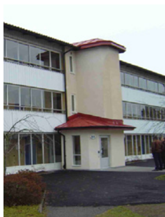
Placering utanpå huset.