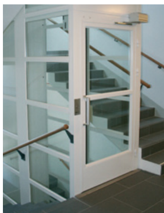
Placering i trapphus med en smalare trappa bredvid.