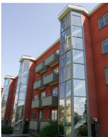
Placering i trapphus. Nytt trapphus utanpå.